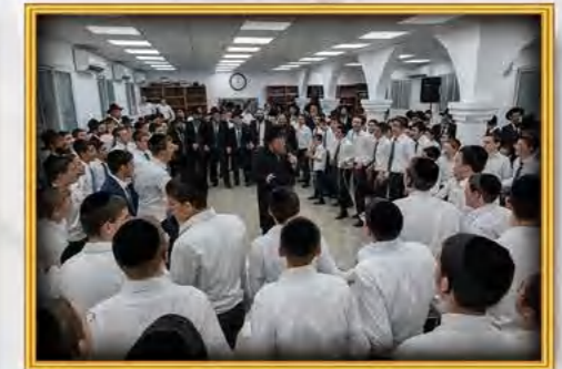
תורת ישראל אופקים