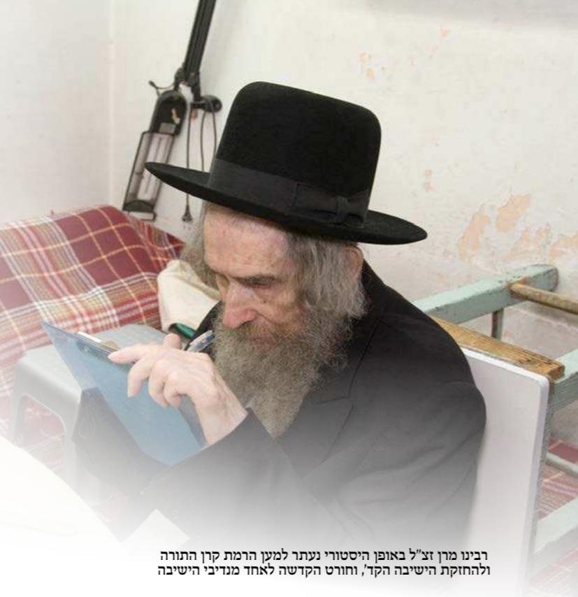
רבינו מרן זצ"ל באופן היסטורי נעתר למען הרמת קרן התורה ולהחזקת הישיבה הקדו, וחזר הקדשה לאחד מנדיבי הישיבה

לפני ולפנים: על חיי הארעי, על פרודודור שהוא טרקלין, ועל אחריות על כלל ישראל. שביבי זכרונות שנאמרו במהלך השיחה המיוחדת לאורו ובמשנתו של אבי הישיבה מרן זצ"ל עם מורינו ראש הישיבה שליט"א