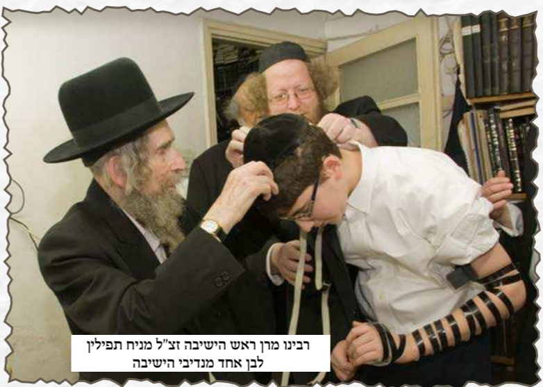
רבינו מרן ראש הישיבה זצ"ל מניח תפילין לבן אחד מנדיבי הישיבה

ראש הישיבה זצ"ל אחז שנסגרת של ישיבה צריכה להיות בנויה על יראת שמים, ובנוסף, גם דברים שאין בעיה שבחור יעשה מחוץ לישיבה - בישיבה לא כדאי להכניס