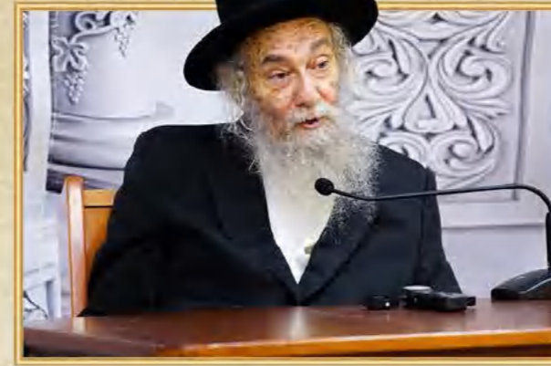
הגאון רבי משה חיים זילברברג שליט"א