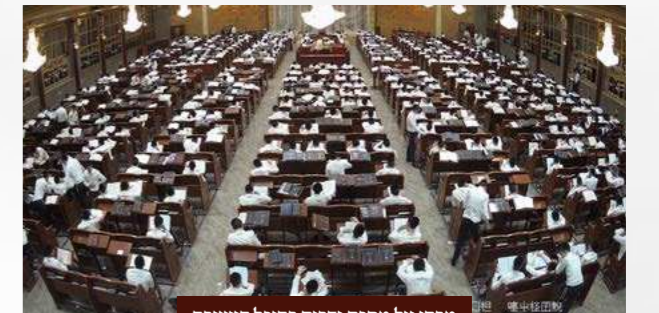
מבחן על מסכת נדרים בהיכל הישיבה

לחשיבות כבוד התורה ידיעת התורה והעמל שבשינון המסכת כולה הדק היטב, בהוראת מורינו רה"י הגרש"ב שליט"א העניקה הנהלת הישיבה מלגות מכובדות מאוד למסיימי מסכת 'נדרים' שעמדו בכוח המבחן בהצלחה מרובה. לכבודה של תורה.