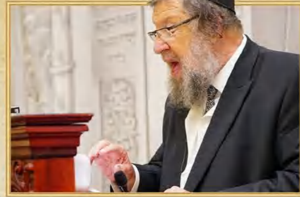
מורינו ראש הישיבה הגאון רבי בנימין סורוצקין שליט"א