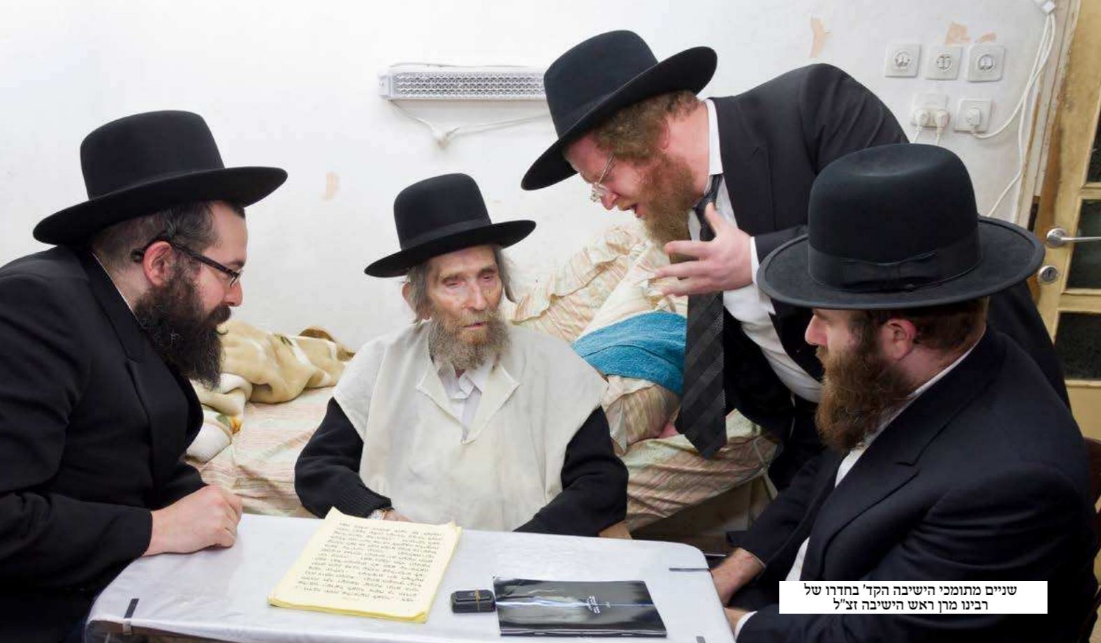
שניים מתומכי הישיבה הקד' בחדרו של רבינו מרן ראש הישיבה זצ"ל

עצום ומנחה דרך. זהו הכלל הראשון בחינוך, שהוא צריך להיות באהבה וחיבה. אבל במה שנוגע לדור שלנו, חז"ל אומרים 'אלף נכנסים למקרא אחד יוצא להוראה', ועל זה אמר ראש הישיבה זצ"ל: "זה היה פעם, אבל דור שלנו אי אפשר להסתפק בכך, היום אנחנו צריכים להילחם על כל אחד ואחד". פעם היו כולם יראים ושלמים, אבל היום שלדאבוננו רובא דרובא אינם שומרי תורה ומצוות, בשביל שיהיה אחד לאלף של פעם - אנחנו צריכים אלף מתוך אלף.