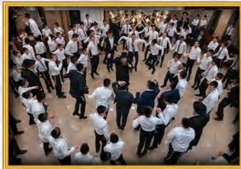
עטרת שלמה אלעד