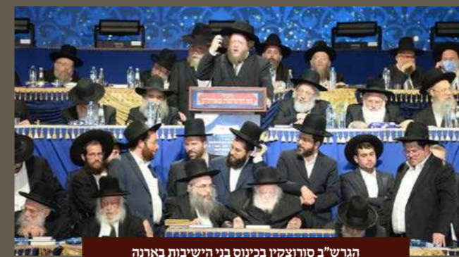
הגרש"ב סורוצקין בכינוס בני הישיבות בארנה

במהלך כינוס רבבת בני הישיבות ב'ארנה' בירושלים לקראת תחילת זמן חורף, במעמד מרן שר התורה הגר"ח קנייבסקי שליט"א, נשא מורינו ראש הישיבה הגרש"ב סורוצקין שליט"א דברי חיזוק מרטיטים, בדבריו עמד על מהות אהבת ה' המתקיימת רק על ידי לימוד