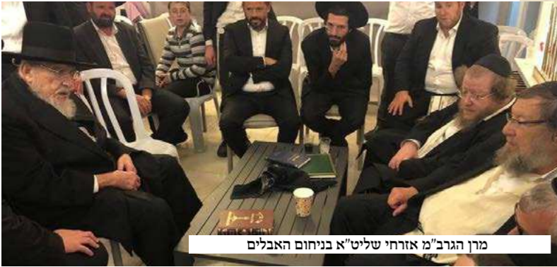
מרן הגרב"מ אורחי שליט"א בניחום האבלים