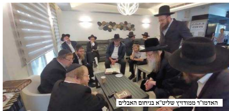
האדמו"ר ממודז'ץ שליט"א בניחום האבלים