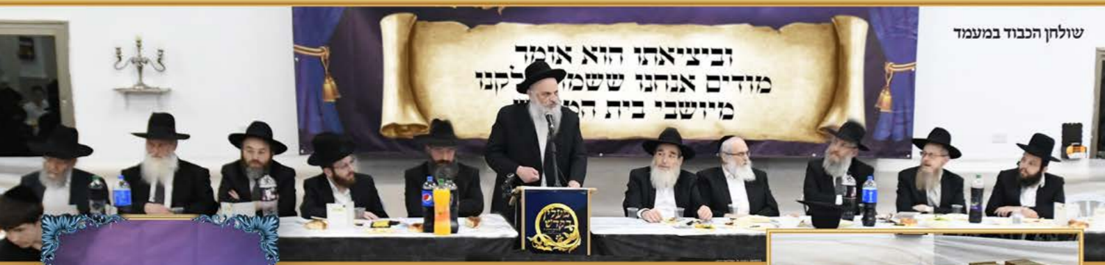
שולחן הכבוד במעמד