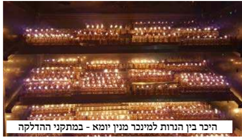
היכר בין הנרות למיכר מנין יומא - במתקני ההדלקה

אך אם סברנו שדי בכך, הרי שכאן התעוררו לשאלה נוספת - שגם היא - נובעת רק מבני 'רשות הרבים' הייחודיים לשיבה. כידוע לכל בר בי רב דחד יומא, לא הרי ימי החנוכה בישיבה כאשר הימים והזמנים. בעוד ישנם מקומות בהם ימים אלו מוכרים כימי רפיון וביטול בית המדרש, בישיבה הק' החזירו עטרה ליושנה ומקיימים בהם את ייעודם המקורי - שהם הניצחון על אלו שביקשו להשכיחנו תורת השם. אשר על כן, הימים