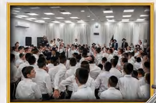
עטרת שלמה ביתר