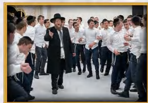
עטרת שלמה ירושלים