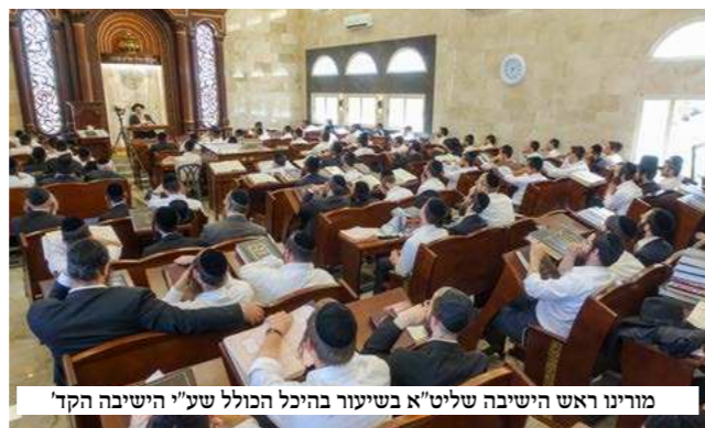
מוריניו ראש הישיבה שליט"א בשיעור בהיכל הכולל שע"י הישיבה הקד'

לאחר מכן הגיע מוריניו ראש הישיבה שליט"א להיכל התורה בכלל שע"י הישיבה הקד' ברמה ג' שם מסר שיעור בסוגיות שבמסכת חולין.