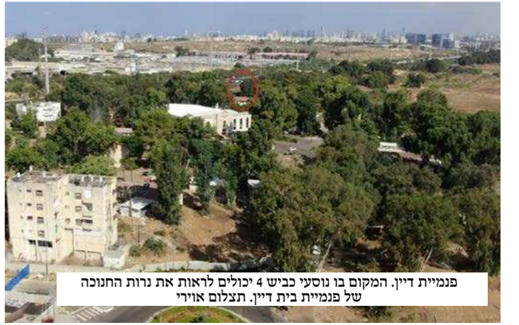
פנמיית דיין. המקום בו נוסעי כביש 4 יכולים לראות את נרות החנוכה של פנמיית בית דיין. תצלום אוויר

ולכאורה הישיבה עומדים בזה על פרישת דרכים - בהיות שתי האפשרויות עומדות בפניהם - להדליק בחלון הפונה לרחבת הישיבה, או למצער, בפתח הפנימייה. אבל כבר זכינו שעומדים על ראשינו רבותינו - מנהיגי הישיבה - שלא הניחו אפילו פרט אחד מלדון בו הדק היטב.