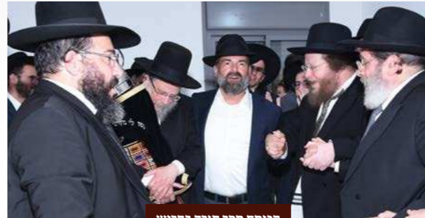
הכנסת ספר תורה בחריש