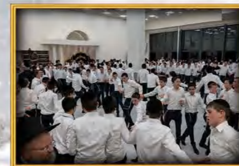
עטרת שלמה ירושלים