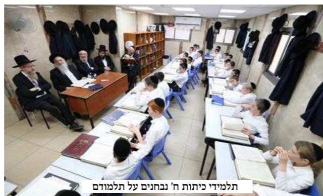
תלמידי כיתות ח' נבחים על תלמודם

בתחילת הדברים נשא דברי חיזוק בפני האברכים על חשיבות עמלה של תורה ועל הזכייה המופלאה של יושבי האוהלים הספונים כל חייהם באוהלה של תורה בעמל.