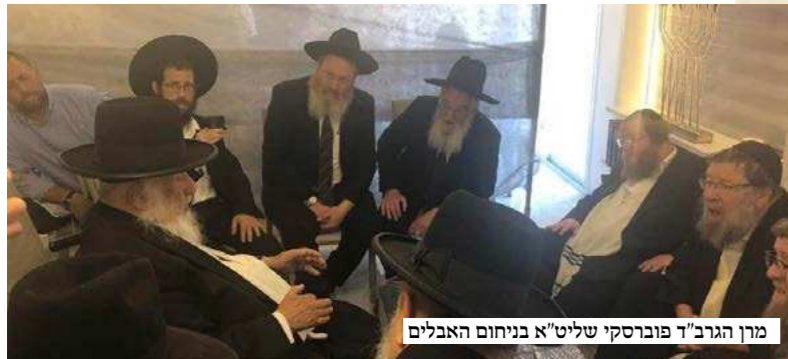
מרן הגרב"ד פורסקי שליט"א בניחום האבלים