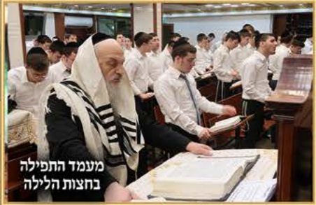
מעמד התפילה בחצות הלילה