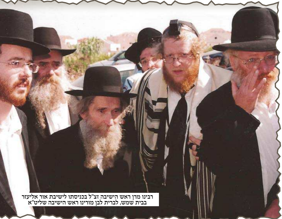
רבינו מרן ראש הישיבה זצ"ל בכניסתו לישיבת אור אליעזר בבית שמש, לברית לבן מורינו ראש הישיבה שליט"א