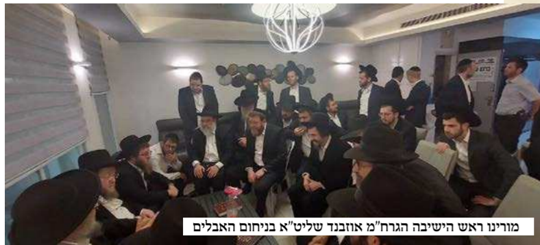
מוריניו ראש הישיבה הגר"ח מ אובנד שליט"א בניחום האבלים