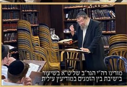
מורינו רה"י הגר"ב שליט"א בשיעור בישיבת בני הזמנים במודיעין עילית