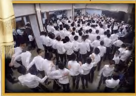
עטרת יוסף בני ברק