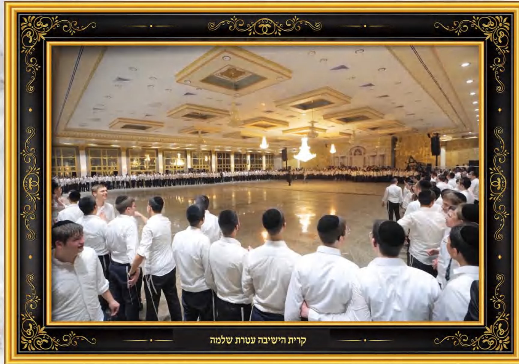
קרית הישיבה עטרת שלמה