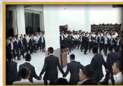
עטרת שלמה ירושלים