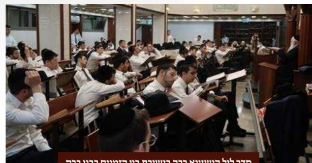
סדר ליל הושענא רבה בישיבת בין הזמנים בבני ברק

כמידי שנה, גם השנה התקיימו ישיבות בין הזמנים שע"י הישיבה הקד', לצד ישיבת בין הזמנים המסורתית בישיבת 'עטרת יוסף' ב"ב, גם במודיעין עילית התקיימה ישיבת בין הזמנים, ובמהלך ימי חול המועד נמסרו שיעורים מיוחדים בהלכות החג מרבותינו ראשי ורבני הישיבה שליט"א.