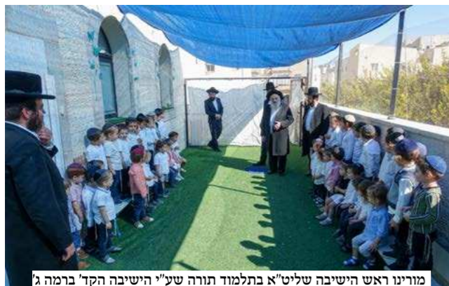
מוריניו ראש הישיבה שליט"א בתלמוד תורה שע"י הישיבה הקד' ברמה ג'