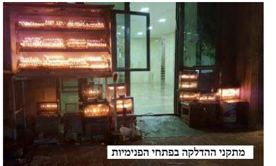
מתקני ההדלקה בפתחי הפנימיית

ואם כן היה מקום לומר שלחלום לאורו של מרנא החזו"א - אין כל תקנה בהדלקת נרות חנוכה בישיבה - אחר שנאסר להם להדליק בפתח חדרם, ואפילו אם יניחו על שולחנם יהיה זה בגדר מצוה הבאה בעביירה, נמצא שאין להם כל אפשרות לקיים תקנה זו, בלתי אם יעקרו דירת מושבם ויגלו ממקור חיותם בכל ימי המועד, דבר שכמובן אינו בא בחשבון מבחינתם.