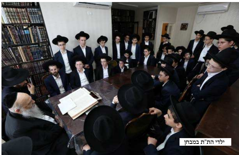
ילדי הת"ת במבחן

ראש הישיבה שליט"א בירך את התלמידים "הקב"ה יעזור שמהשמחה הזאת שיש בסיום, השמחה הגדולה בפמליא של מעלה, יושפע ברכה על התלמידים היקרים ועל ההורים החשובים ובני המשפחות, ועל המנהלים והמחנכים והמלמדים שליט"א שהם מצדיקי הרבים, כולם יבורכו ויזכו ללמוד וללמד לשמור ולעשות ולקיים".