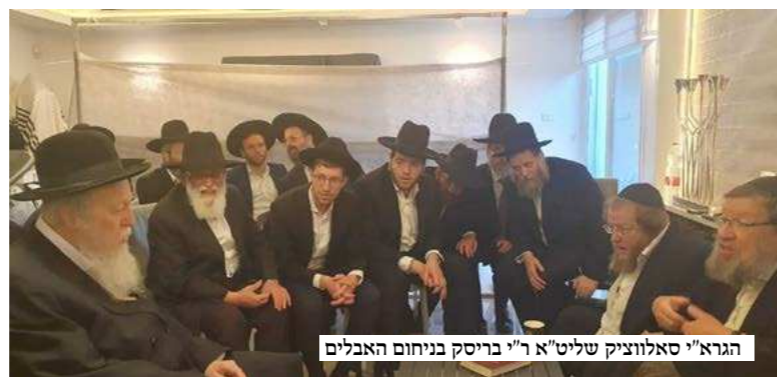
הגרא"י סאלווציק שליט"א ר"י בריסק בניחום האבלים