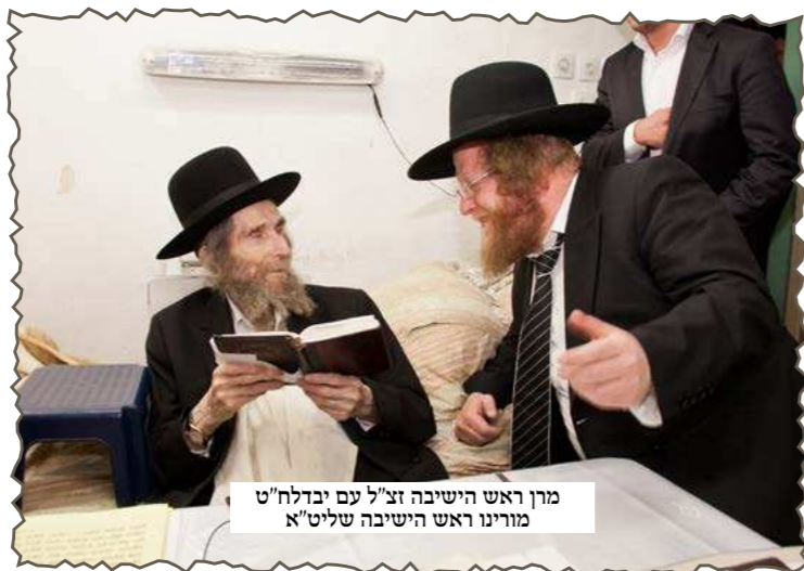
מרן ראש הישיבה זצ"ל עם יבדלח"ט מורינו ראש הישיבה שליט"א

כמובן, העניין העיקרי בזה הוא ידיעת התורה כמו שפתחתי, אבל יש גם את המעלה הזאת, ויש עוד מעלה: הרי לו יהי שסוף-זמן זה רק רפיון בלימוד. אולם איך מתחיל אם כן אצל הבחור הזה הזמן הבא, הרי 'אם תעזבני יום יומיים אעזבך' זה דבר שכל אחד יודע ומכיר. לעומת זאת, בחור שסיים את הזמן בשטייגען של רציפות בתורה ובעלייה, הבין הזמנים מרומם יותר והזמן הבא שלו הרבה יותר מוצלח. זה בדוק ומנוסה.