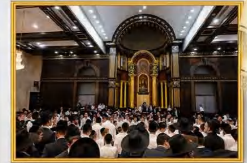
עטרת יוסף שלום מודיעין עילית