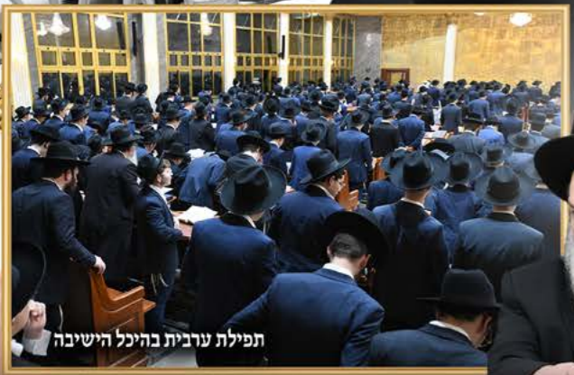
תפילת ערבית בהיכל הישיבה