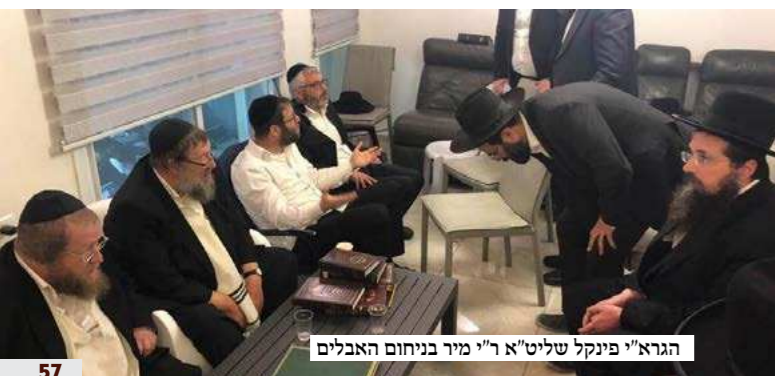
הגרא"י פינקל שליט"א ר"י מיר בניחום האבלים