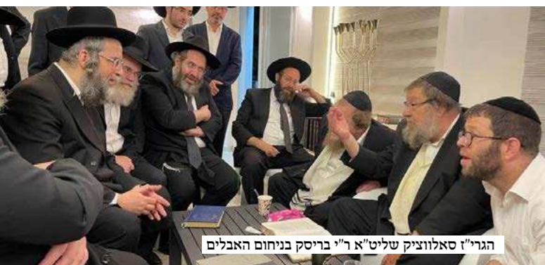
הגרי"ז סאלווציק שליט"א ר"י בריסק בניחום האבלים